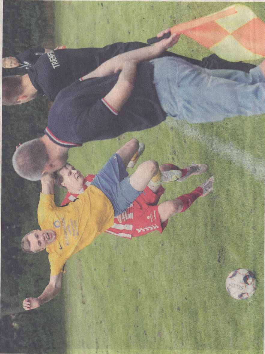
o Sparkær-lejren var frustreret over de mange misbrugte muligheder.

Gæsterne scorede to gange inden der var spillet en halv time – og det forvandt SIF'erne ikke, trods et mas-sivt spilovertag, og efter den første halve time satte hjemmeholdet sig totalt på opgøret – men manglede skarphe