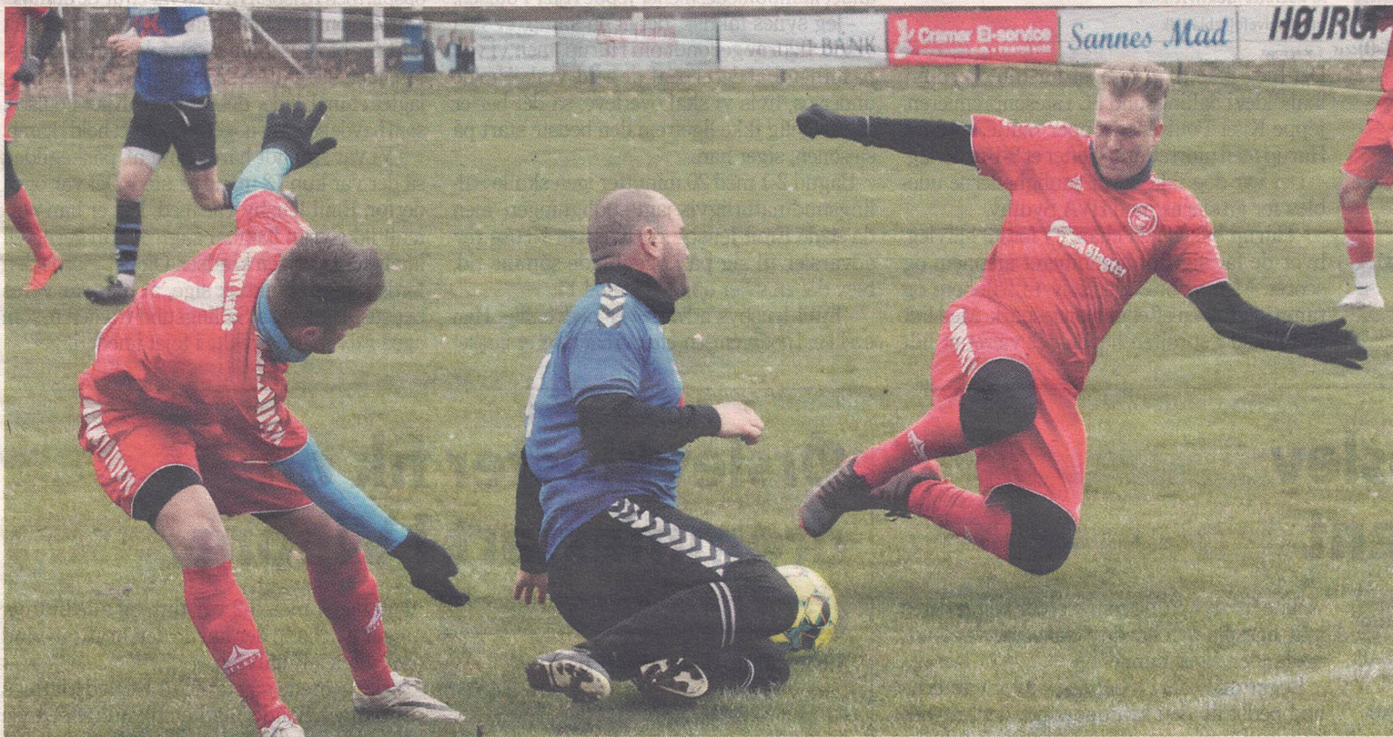
● Mønsted trak sig sejrrigt ud af lokalopgøret mod Sparkær.