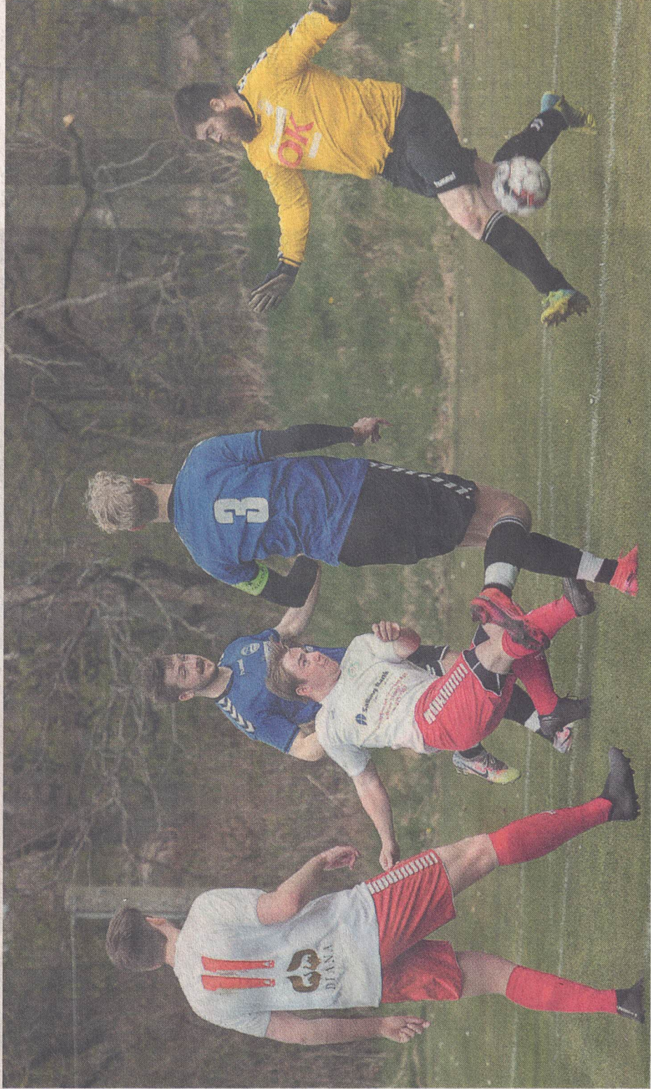
Ørlevskloster har gjort rent bord i sæsonens fire første kampe.