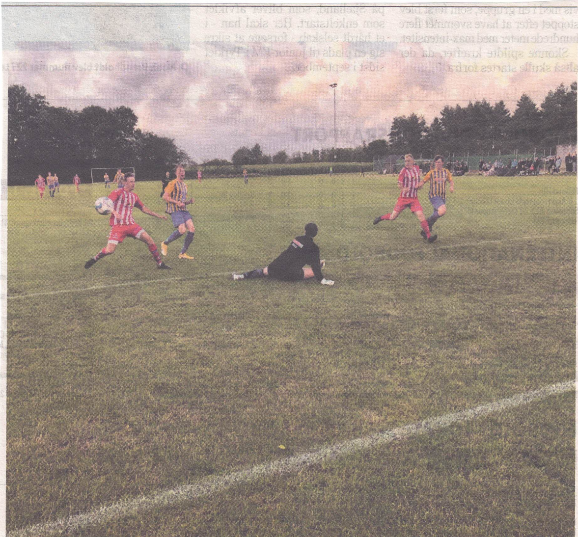
○ Sparkær kom videre efter skuffelsen i Fjends Cup-semifinalen med en indsats mod Alheden, hvor alle mand leverede tæt på 100 procent.

Mads Vistisen løb med stemmerne i fiduspokal-konkurrencen.