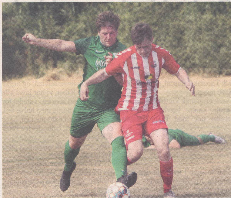
○ Sparkær var ovenpå i Bruunshåb, og værternes føring på 2-0 var ikke nok til at stoppe fjandboerne.